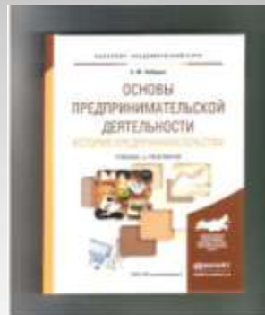
Чеберко Е.Ф. Основы предпринимательской деятельности.