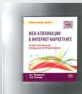
Винарский Я.С. WEB-аппликации в интернет-маркетинге