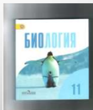
Биология 11 класс