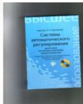
Системы автоматического регулирования.