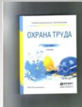
Карнаух Н.Н. Охрана труда.