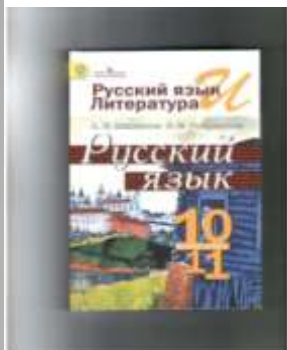
Власенков А.И. Русский язык и литература.