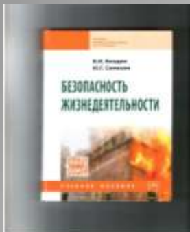
Бондин В.И. Безопасность жизнедеятельности.