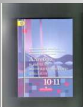
Математика: алгебра и начала математического анализа.