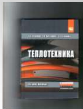
Кудинов В.А. Теплотехника.