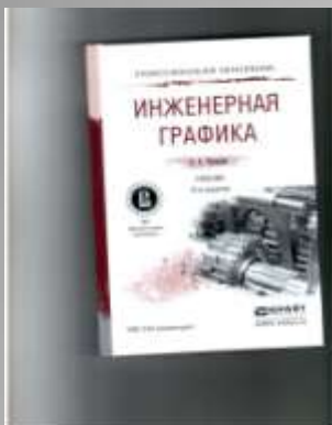
Чекмарёв А.А. Инженерная графика.