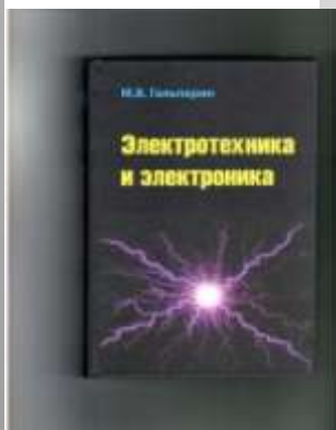
Гальперин М.В. Электротехника и электроника.