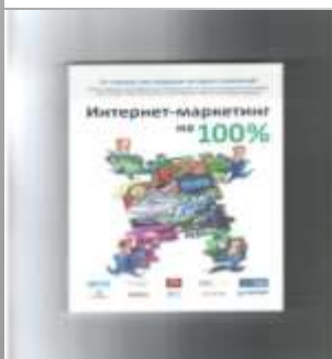
Винарский Я.С. Интернет-маркетинг На 100%.