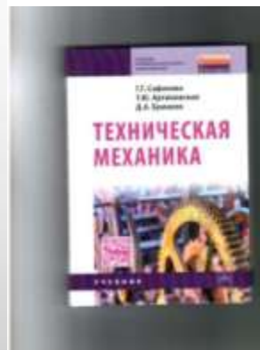
Сафронова Г.Г. Техническая механика.