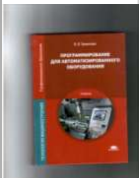
Ермолаев В.В. Программирование для автоматизированного оборудования.