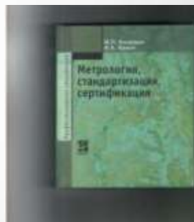
Кошечкина И.П. Метрология, стандартизация, Сертификация.