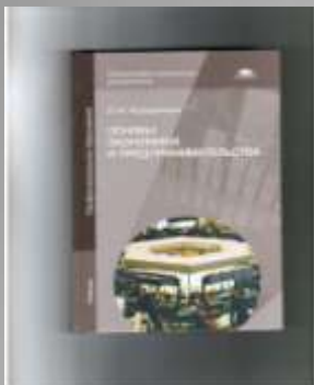
Череданова Л.Н. Основы экономики и предпринимательства.